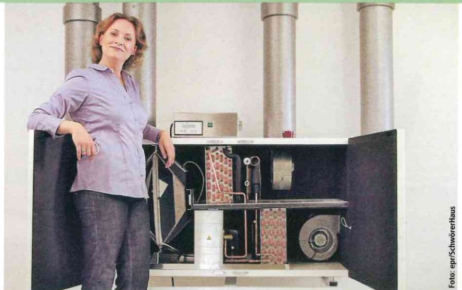
Kühlen Kopf bewahren: Ein Muss in gut gedämmten Neubauten ist eine kontrollierte Wohnraumlüftung mit Wärmerückgewinnung. Der Fertighaushersteller SchwörerHaus bietet diese als Bestandteil eines Komplettsystems, der Frischluftheizung, an.