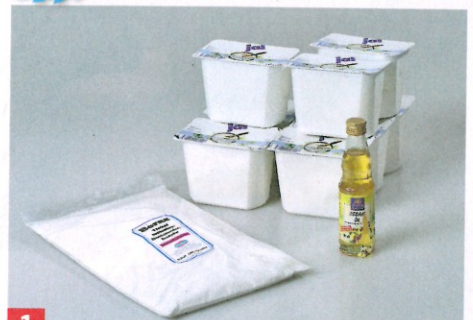
1 Die Zutaten unserer Einkaufsliste links ergeben rund vier Liter naturnaher Farbe für rund 40 Quadratmeter Fläche. 3)

3) nur 2 bis 3 Euro/Liter Farbe kostet diese Mischung