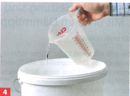
4 Wasser-Borax-Lösung dann noch heiß über den Magerquark gießen.