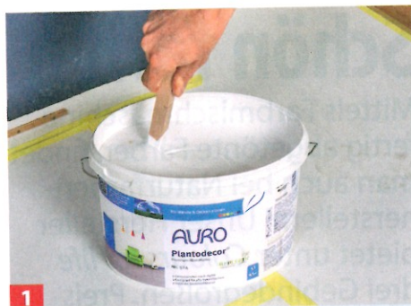
1 Wie gehabt: Stark oder ungleichmäßig saugende Untergründe grundieren und die Farbe (Auro Plantodecor) 1) gut aufrühren.

Vergessen Sie alles, was Sie über Naturfarben gehört haben: Die weiße Wandfarbe rechts lässt sich nicht nur genauso gut verarbeiten wie herkömmliche, sondern sie deckt auch sehr gut. Klar: Deckkraftklasse 1 plus Nassabriebbeständigkeit Klasse 1!