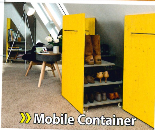
» Mobile Container

» VOGELHAUS Futtersilo aus Restmaterialien