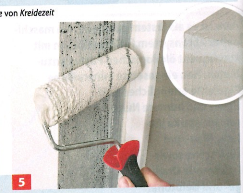
5 ... dadurch nicht verwirren und tragen Sie sie nicht zu dick auf. Einfach trocknen lassen, sie deckt gut, aber etwas gräulicher.