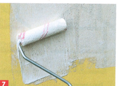
7 Auch hier nicht zu dick auftragen und Trocknung abwarten – die Deckung ist besser als man denkt.