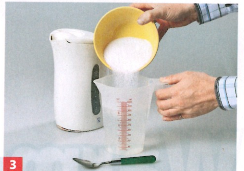
3 Nun das Wasser aufkochen und das zuvor abgewogene Borax (erhältlich in der Apotheke) in das noch heiße Wasser einrühren.

3) nur 2 bis 3 Euro/Liter Farbe kostet diese Mischung