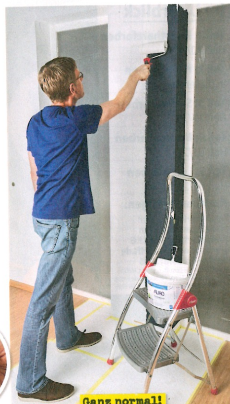
Ganz normal! Die Konsistenz dieser Naturfarbe ist ganz geschmeidig wie bei Kunstharzfarbe, die Deckkraft entsprechend Klasse 1 sehr gut.