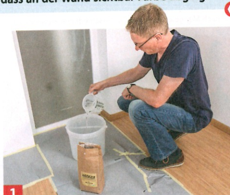
1 1 kg Farbpulver rund 600 bis 700 ml Wasser begeben, um eine streichfähige Konsistenz herzustellen. Vorher unbehandelte und ...

Preiswerter als mit fix und fertig angemischter Farbe geht es mit Trockenpulver. Mit 6 bis 7 Euro/Liter Farbe 2) muss man in unserem Fall rechnen. Das Anrühren mit Wasser ist aber umständlicher, Auftrag und Deckung sind dafür besser als man denkt.