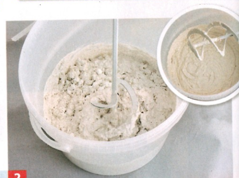
2 ... stark oder ungleichmäßig saugende Untergründe grundieren. Die Farbe mit Rührwerk klümpchenfrei anrühren.

2) rund 105 bis 120 Euro kostet ein 25-Liter-Sack Vega Wandfarbe von Kreidezeit