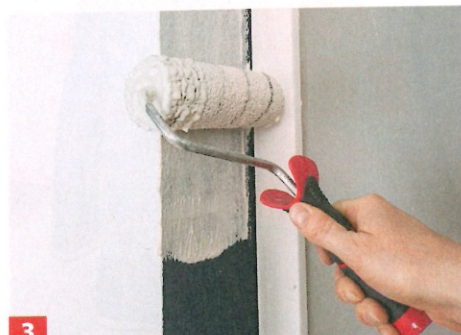
3 Farbe 30 Min. quellen lassen, dann nochmals aufrühren. Tragen Sie sie gleichmäßig, ansatzfrei und dünn auf. Eckbereiche wie ...