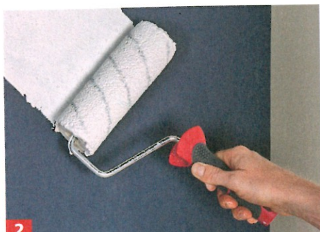
2 Die dunkle Wand konnte man mit einem Mal überstreichen: Nur kurz antrocknen lassen und dann nochmals darüberrollen – fertig!