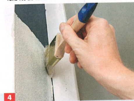
4 ... gewohnt mit Pinsel streichen. In feuchtem Zustand ist die Farbe wie im Merkblatt angegeben durchscheinend. Lassen Sie sich ...