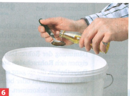
6 Zum Schluss das Öl und die Pigmente unterrühren. Statt weiß kann man die Farbe natürlich auch mit Farbpigmenten abtönen.