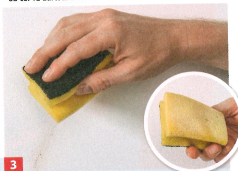
3 Schmutz ließ sich auch gut abwischen. Wir haben Erde und Kaffeesatz beseitigt, ohne dass an der Wand sichtbar Farbe abging.