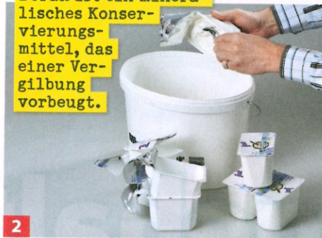
2 Füllen Sie den Magerquark zunächst in ein ausreichend großes Mischgefäß – zum Beispiel einen sauberen Eimer.

Borax ist ein mineralisches Konservierungsmittel, das einer Vergilbung vorbeugt.